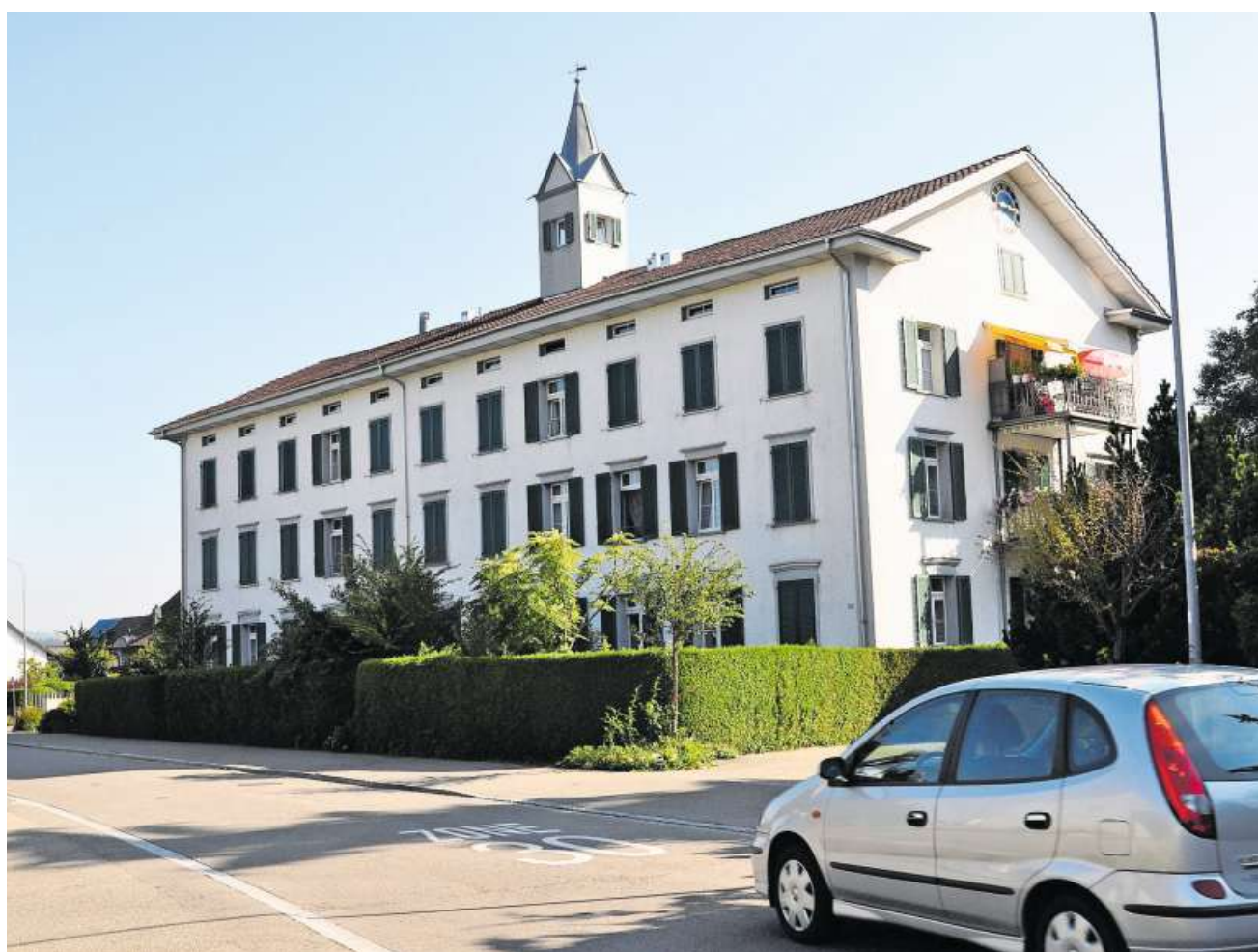
Die ehemalige Weberei in Münchwilen diente einst als Mädchenheim. Heute wohnen hier Familien.