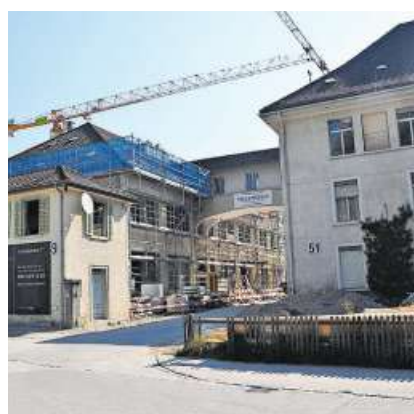
Auf dem Walzmühlareal, wo Sigg einst Trinkflaschen herstellte, entstehen zurzeit Loftwohnungen.