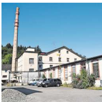
Auf dem Fabrikgelände in der Murkart gibt es seit Anfang der 1970er-Jahre kaum Entwicklung.