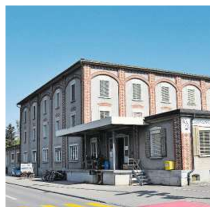
Die Zwirnerei Rosental ist heute noch in Betrieb, braucht aber nicht mehr das ganze Gebäude.